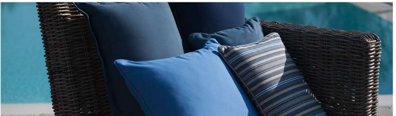
Fantasy Negro 3778